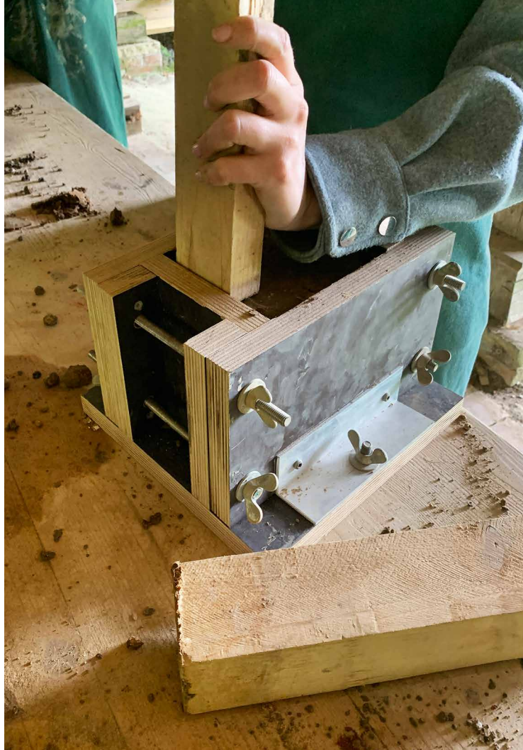
Nachhaltiger Baustoff: Familien stampfen und formen eigenen Lehmwürfel.