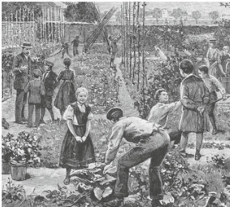
Schulgärten spielten in der Arbeitsschule eine wichtige Rolle. «Der Schulgarten kann ferner ein vorzügliches Erziehungs- und Unterrichtsmittel werden; er führt täglich die nützlichen Gegenstände vor das Auge des Kindes und fördert dadurch das Interesse für die kultivierten Obstbäume, Sträucher, Blumen und Gemüse. Der Schulgarten kann für die Kinder ein Versuchs- und Übungsfeld sein und dadurch die Selbstständigkeit für die Ausführung haus- und landwirtschaftlicher Arbeiten, gestützt auf eigene Erfahrungen, wecken.» (Preussische Ministerialverfügung 1903). Bild: Horst Schiffler, Rolf Winkler (1999): Tausend Jahre Schule. Eine Kulturgeschichte in Bildern. 6. Auflage, Belsler Verlag, Stuttgart und Zürich, S. 114.

Wirkung erzeugen. Die Frage stellt sich allerdings, was sich bei den Lernenden tut. Bleiben sie passiv, dann wird die Metapher «eintrichtern» hervorgeholt. Trifft das so nicht zu, dann wird das Kind in verschiedenen Graden als aktiv gedeutet.